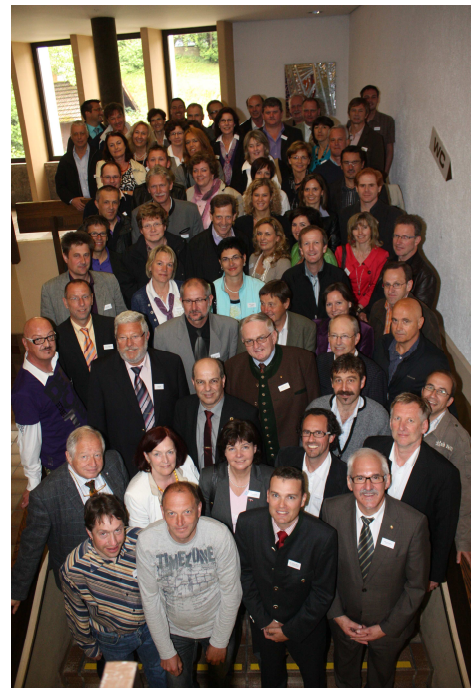
Landestagung Tirol am 27.05.2010 in Jenbach